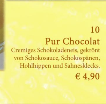
10 Pur Chocolat Cremiges Schokoladeneis, gekrönt von Schokosauce, Schokospänen, Hohlhippen und Sahnesklecks. € 4,90