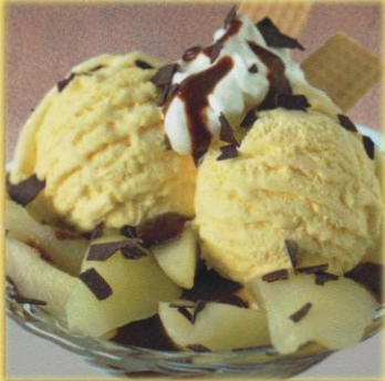
3 Birne Helene Klassische Kombination aus cremigem Vanilleeis*, garniert mit einer Birnenhälfte, Sahne- häubchen und Schokoladensauce. € 4,90