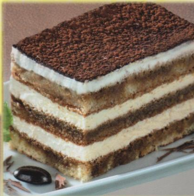
7 Tiramisu* Original italienische Süßspeise aus Biskuitbodenschichten, gefüllt mit einer Kaffee-Zabaiionecreme, mit Kakaopulver bestäubt. € 3,50