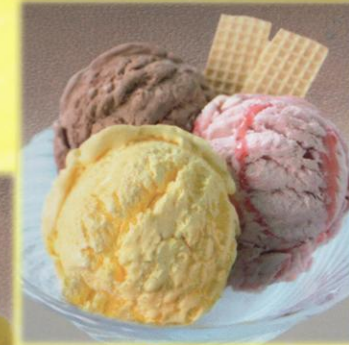
9 Gemischtes Eis Leckerles Eis nach Wahl, garniert mit Eiswaffeln. € 3,00