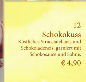
12 Schokokuss Köstliches Stracciatellaeis und Schokoladeneis, garniert mit Schokosauce und Sahne. € 4,90