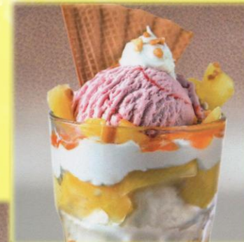
11 Fruit Kiss Fruchtiges Erdbeereis mit Ananasstückchen und Naturjoghurt serviert, garniert mit Sahne und Eiswaffel. € 3,90