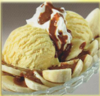
1 Bananensplit Cremiges Vanilleeis*, serviert mit Bananenstücken, Sahne und Schokoladensauce. € 4,90