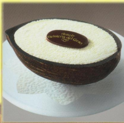
5 Cocosnuss* Köstliches Kokosnusseis in einer halben Kokosnussschale. € 3,90